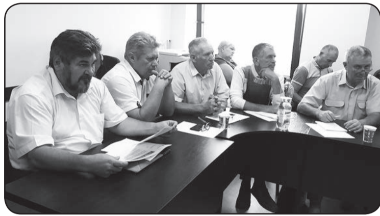
Під час засідання Ради АФЗУ.